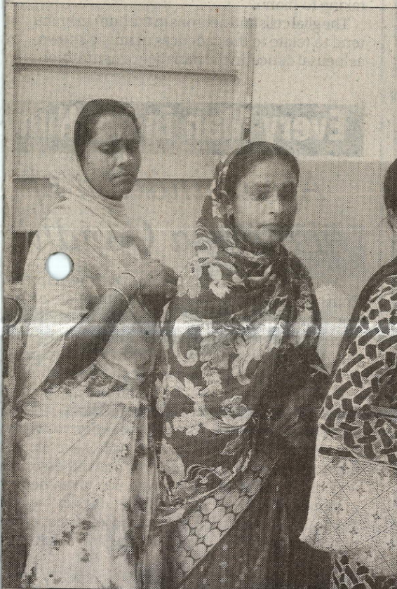
in Kolkata on Thursday. Rising number of dengue cases

The minister said that one of the eight PMKSY projects in Andhra had been completed. Six others would be completed within the current financial year.