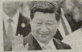
बीजिंग

चीन के राष्ट्रपति शी चिनफिंग ने मंगलवार को कहा कि चीन अपनी संप्रभुता और सुरक्षा से कभी समझौता नहीं करेगा और उसकी सेना हर हमले को विफल करने के लिए आश्वस्त है। शी ने 23 लाख जवानों वाली पीपल्स लिबरेशन आर्मी पीएलए की 90वीं वर्षगांठ के अवसर पर आयोजित विशेष आयोजन में अपने संबोधन में कहा, हम किसी भी व्यक्ति, संगठन या राजनीतिक दल को चीन के किसी भी हिस्से को देश से कभी भी, किसी भी रूप में अलग करने की इजाजत नहीं देंगे। शी की यह टिप्पणी ऐसे समय पर आई है, जब चीन और भारत के बीच सिक्किम सेक्टर में गतिरोध चल रहा है। शी ने कहा, चीनी जनता शांतिप्रेमी है।